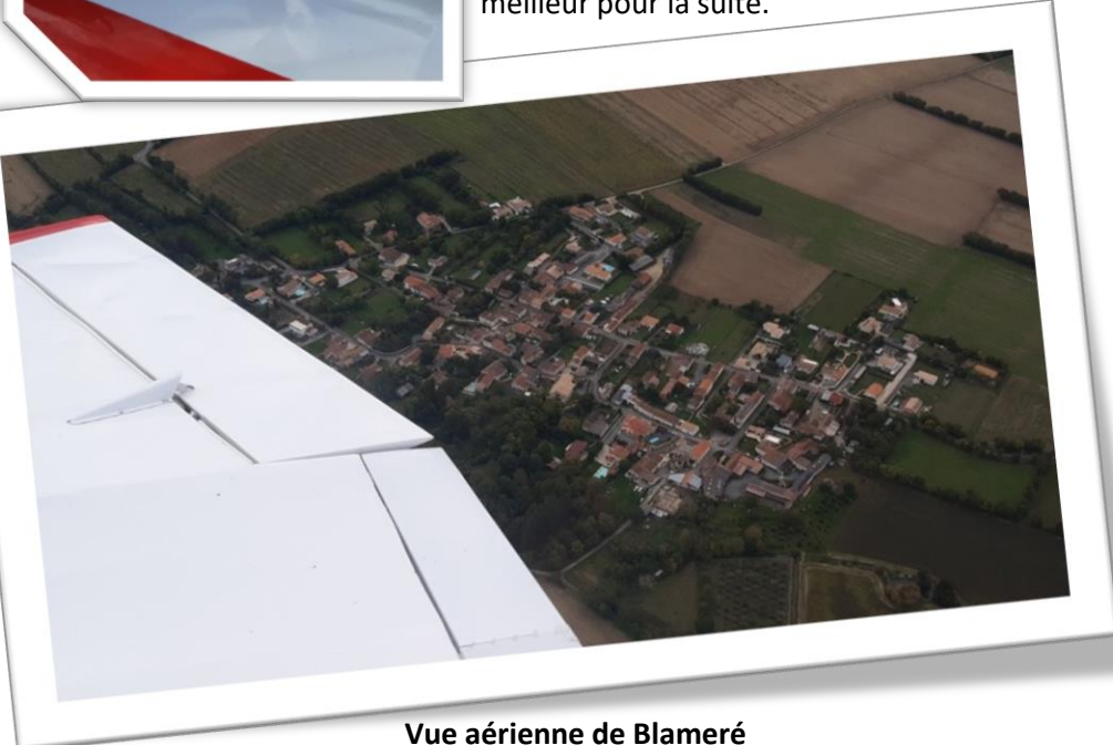
Vue aérienne de Blameré